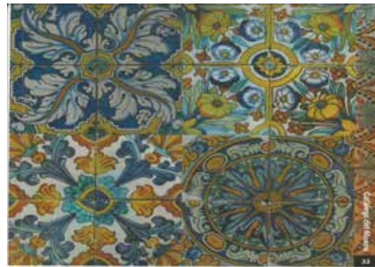
UNA HISTÒRIA DE RAJOLES LA COL·LECCIÓ DEL MUSEU DE TERRASSA