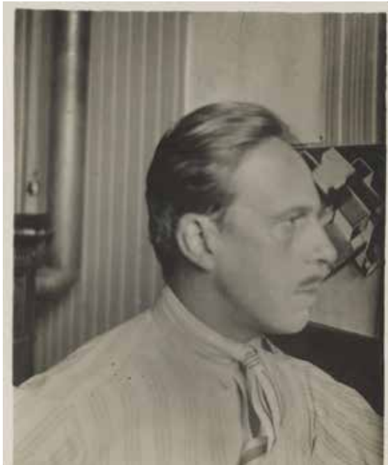
Fig.9. Theo van Doesburg, c.1929.

Van Doesburg el tornava a escriure. Aquesta carta, pel seu contingut, es detecta que es deuria creuar amb la que Dalmau va escriure en tornar de vacances: