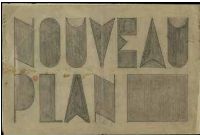
Fig.6. Theo van Doesburg, maqueta de la revista Nouveau Plan , 1929. Recte. Llapis/paper. Bifoli, 25 x 16,4 cm. Arxiu Municipal de Girona, FDGDB, Reg. 573.FDGDB, Reg. 580.

Avec nos meilleures salutations et l'espérance de succès avec Nouveau Plan.» 22