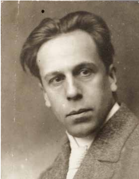
Fig.1. Theo van Doesburg, c.1920. Nederlands Instituut voor Kunst- geschiedenis. RKD archive ATND.

La primera notícia que tenim de la relació de Theo van Doesburg amb Catalunya fou la publicació del seu article en francès L'Art Monumental , l'any 1920 a la revista sitgetana Terramar (1919-1920). 1 En aquell moment, el poeta Joan Salvat Papasseit i Theo van Doesburg ja mantenien una relació epistolar. Tot i que la coneixença d'aquesta relació havia estat fins ara unidireccional, és a dir, que es coneixia la correspondència o part d'ella del segon cap al primer. 2 Per tant, les dades fins ara desconegudes que aportem, permeten establir un lligam molt més fiable del que fou aquesta relació. A més de les cinc cartes conegudes de Theo van Doesburg a Salvat Papasseit, datades del 15 de gener de 1920 al 2 de juny de 1921, se n'ha d'afegir una altra, de Petro van Doesburg, dona de Theo, de l'11 de maig de 1921 demanant a Papasseit informació sobre música d'avantguarda espanyola. La primera carta de van Doesburg respon a una primera de Papasseit 3 en la qual li fa saber que té a la seva disposició algunes fotografies de la seva obra per a publicar dins una revista anunciada per Papasseit i celebra, també, la futura traducció del llibre Poemes en ondes hertzianes . A més, li agraeix la seva adhesió als punts 3, 4 i 7 del seu manifest 4 i la informació que li dona sobre la publicació de ressenyes de la revista De Stijl i del seu