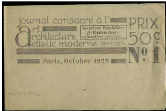
Fig.7. Theo van Doesburg, maqueta de la revista Nouveau Plan, 1929. Vers. Llapis sobre paper. Bifoli, 25 x 16,4 cm. Arxiu Municipal de Girona, FDGDB, Reg. 573.