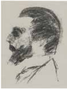
Fig.10. Max Jacob, Retrat de Josep Dalmau , 1929. Reprod. Mirador , Barcelona, 28/11/1929 (Sucre 1929).

Dues cartes conservades a l'arxiu de Theo van Doesburg finalitzen documentalment aquest projecte de revista tot i que no pas verbalment doncs Dalmau i van Doesburg havien de trobar-se amb motiu d'un proper viatge a Barcelona de l'holandès. Van Doesburg havia estat convidat pels alumnes d'arquitectura a donar una conferència a la Sala Mozart i volia aprofitar el viatge per a impartir una altra conferència sobre pintura actual amb l'exposició d'unes quinze peces a les Galeries Dalmau. Van Doesburg li escrivia el dia 23 d'abril: