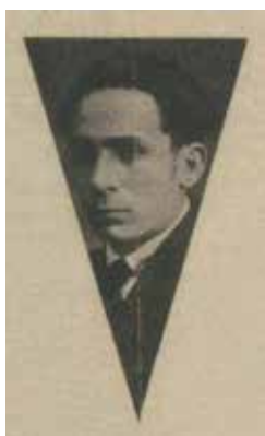
Fig.4. Retrat de Joan Salvat-Papasseit, 1920.