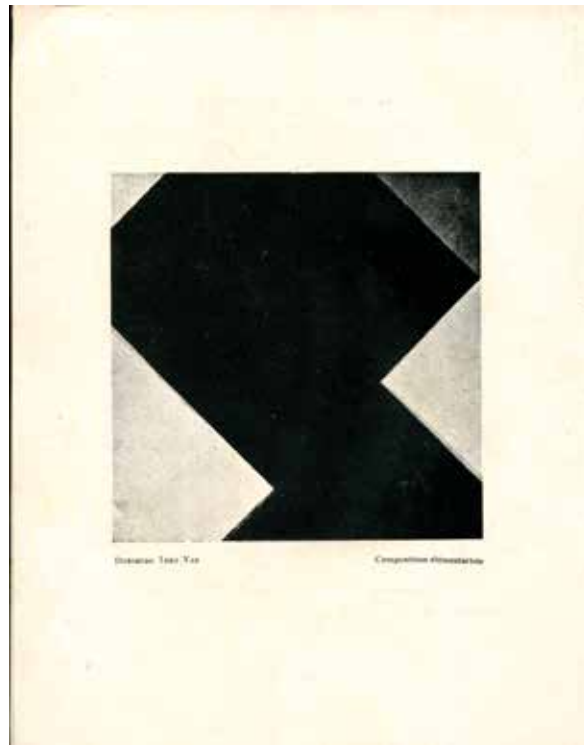
Fig.11.Theo van Doesburg, Composition élémentariste , 1929.

Reprod. al catàleg Exposició d'Art Modern i Estranger , Galeries Dalmau, novembre de 1929.