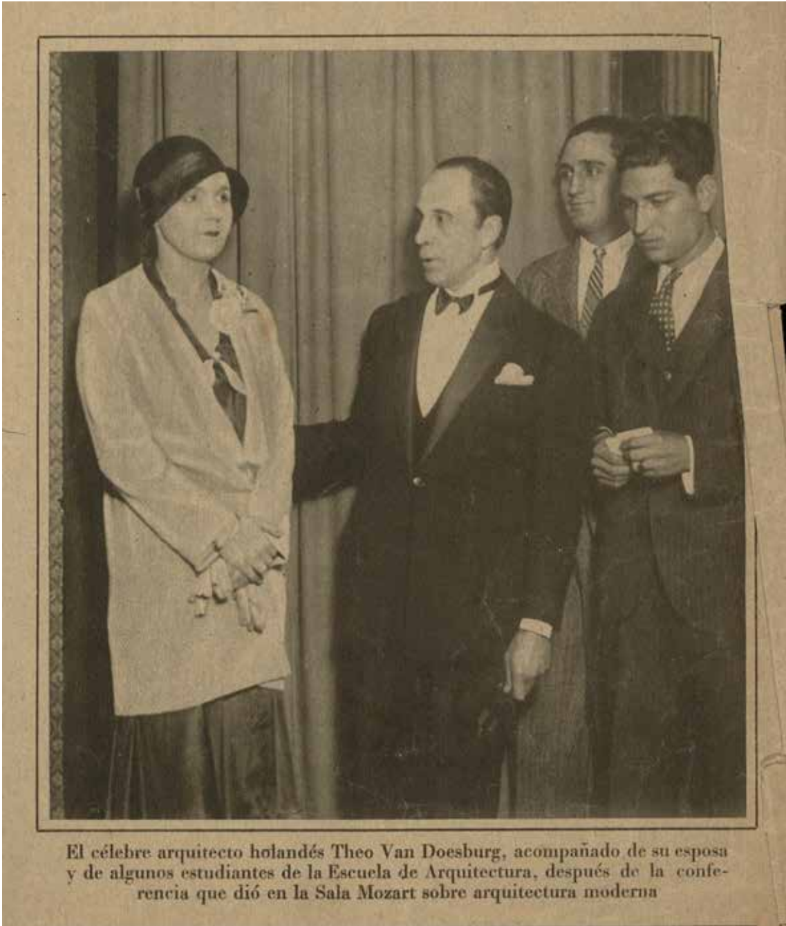
Fig.12. Reportatge gràfic sobre l'estada de Theo van Doesburg a Barcelona per a donar una conferència a la Sala Mozart. Reprod. La Vanguardia , 13/5/1930.