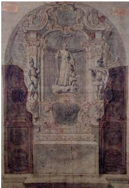
Fig.3. Francesc Tramullas, Traça de retaule dedicat a sant Gaietà . Col.Mercader (dibuix posat a contrallum)

decoratives lleugerament diferenciades per tal d'embellir l'espai de culte on l'obra estava destinada. Copsem en ambdues obres els mateixos protagonistes, però en el primer dibuix, per exemple, hi veiem uns angelets a l'àtic acompanyant uns gerros, que en el segon han desaparegut. La principal diferència entre les dues traces la veiem en el tancament dels cossos laterals. Mentre que en el dibuix descrit per Bassegoda apreciem una posició un xic reculada dels carrers o braços laterals respecte el cos central del moble, atorgant-li a aquest la preeminència. En el dibuix recentment trobat veiem com els cossos laterals s'atansen lleument en forma de curvatura cap endavant fins gairebé la mesa d'altar, apropant-se al fidel. Els subtils tocs d'aiguada grisa aconsegueixen recrear l'efecte realista i ombrívol de la planta