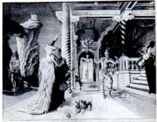
"The Duel with One's Self" guanyadora del premi de l'Institut Carnegie de Pittsburgh el 1939. Exemple del seu món surrealista en parangó amb el de Dalí