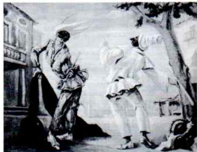
"Bastinadoes" presentat el 1935 a l'exposició de l'Institut Carnegie de Pittsburgh. Exemple de la seva passió pels personatges de la Comèdia de l'Art.