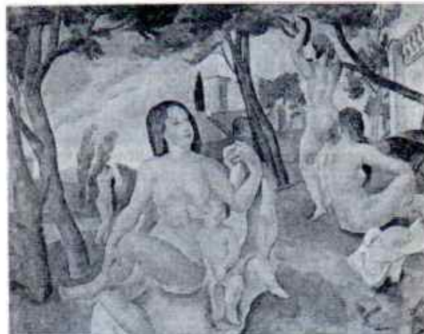
"Baryistes" presentat el 1927 a l'exposició Tokio-Osaka. Figures rotundes i escultòriques dins del món de les formes picassianes