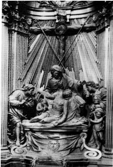
Fig 4: Juan Adán. Retaule de la Pietat , a la Seu Nova de Lleida.

A diferència de l'anterior capella, la de la Immaculada és una prova del domini artístic d'Adán, tant en l'escultura com en els elements arquitectònics. Les estàtues d'aquest retaule són considerades com les més per-