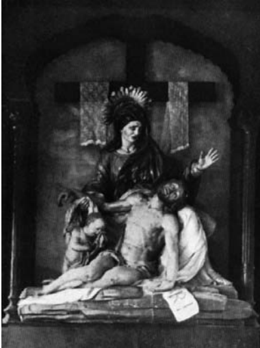
Fig 3: Juan Adán. Nuestra Señora de las Angustias al Real Colegio de las Escuelas Pías de Madrid.