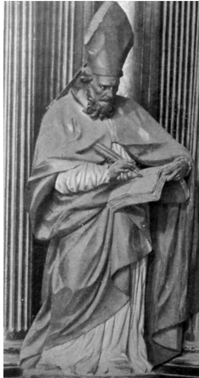
Fig 2: Juan Adán. Sant Agustí, del Retaule de la Immaculada , a la Seu Nova de Lleida.