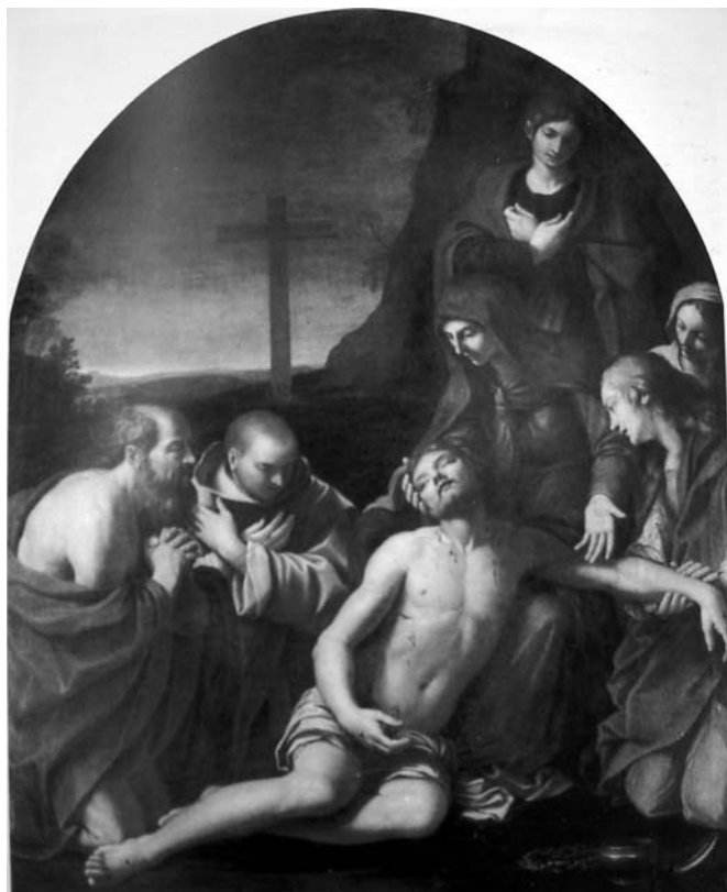
Fig. 5: Juan Adán, Nuestra Señora de las Angustias al Real Colegio de las Escuelas Pías de Madrid.

fectes de la Seu 24 . Aquesta capella és un projecte de 1778 just arribat de Roma i pensem que encara estava influenciat pel que va viure a Roma i, per tant, no es deixà arrossegar per la tradició abarroçada. Adán recuperà l'esperit portat de Roma un cop establert a Madrid.