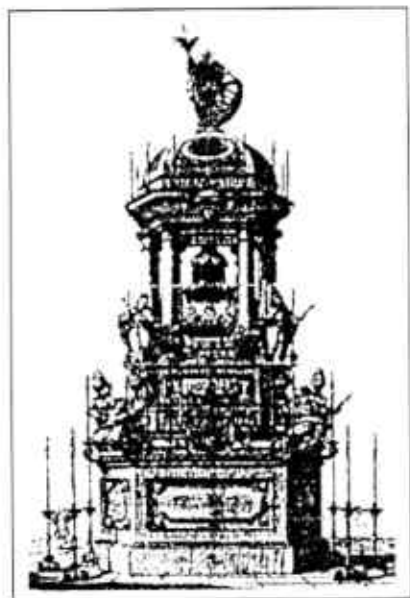
Fig. núm. 1. Túmulo al Conde de Perleda. Convento de Santa Catalina. Barcelona, 1756. Proyecto de Manuel Tramullas - Grabado de Ignasi Valls (Biblioteca de Catalunya, Fullets Bonsoms 3200).

A través de los túmulos de Richardí, Pereleda, Lacy y Láncaster, y de una forma sintética, hemos apreciado como perviven, cambian y se esfuman formas y conceptos delante de la vía clasicista rigurosa que se impone.