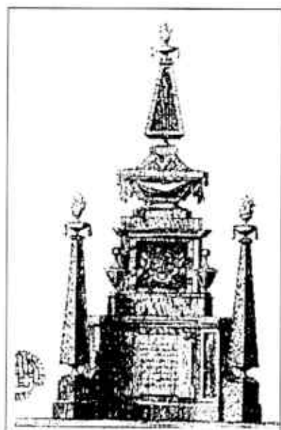
Fig. núm. 3. Túmulo al Duque de Láncaster Parroquia de Santa María del Mar. Barcelona 1802. (Biblioteca de la Universidad de Barcelona C-239/5/15-7).