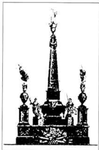
Fig. núm. 2. Túmulo al Conde Lacy. Convento de San Agustín Nuevo. Barcelona, 1793. Proyecto de Pere Pau de Montaña. Grabado de Pasqual Pere Moles. (Museu d'Art Modern de Catalunya, R. 4140).